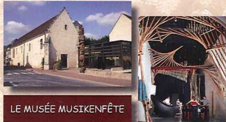
LE MUSÉE MUSIKENFÊTE

Paris : 200 Km Blois : 50 Km Tours : 50 Km Le Mans : 70 Km