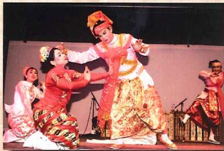
LE FESTIVAL DE FOLKLORE DU MONDE EN AOÛT