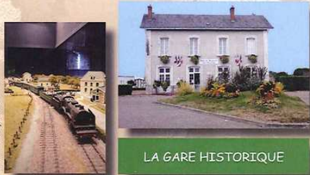
LA GARE HISTORIQUE